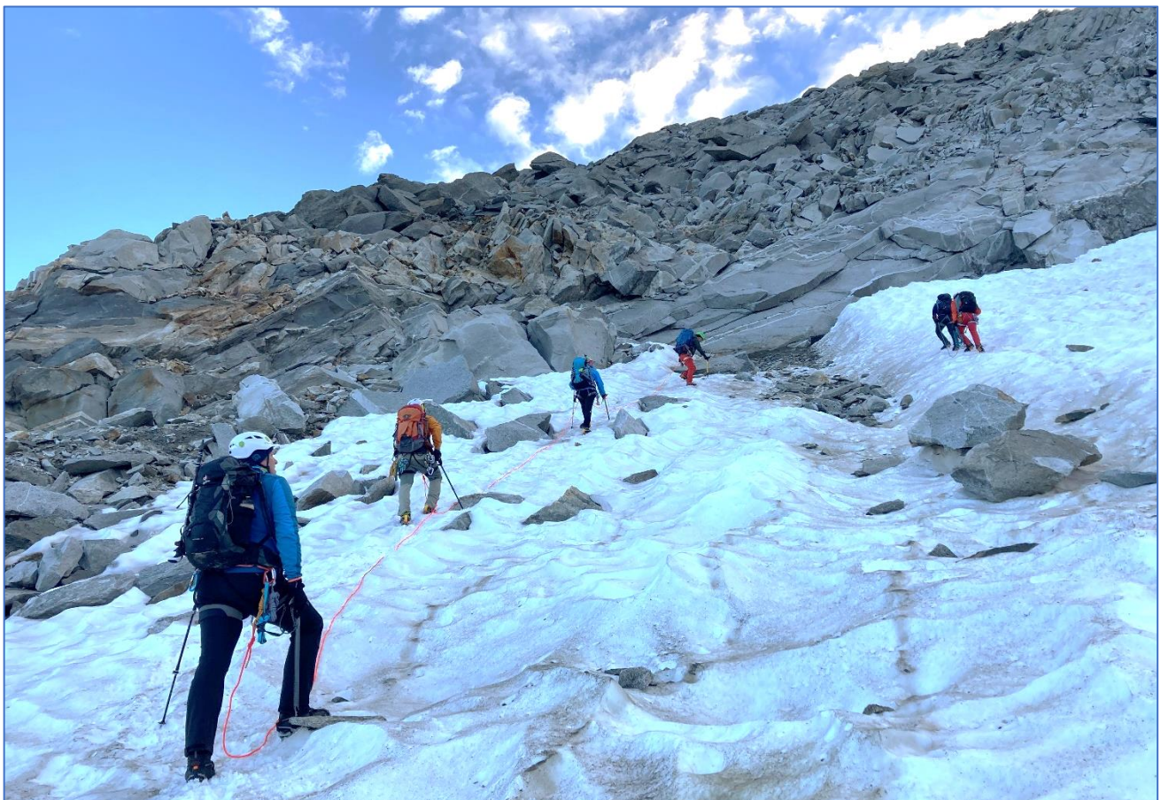
Gr. Mösele, 3480 m