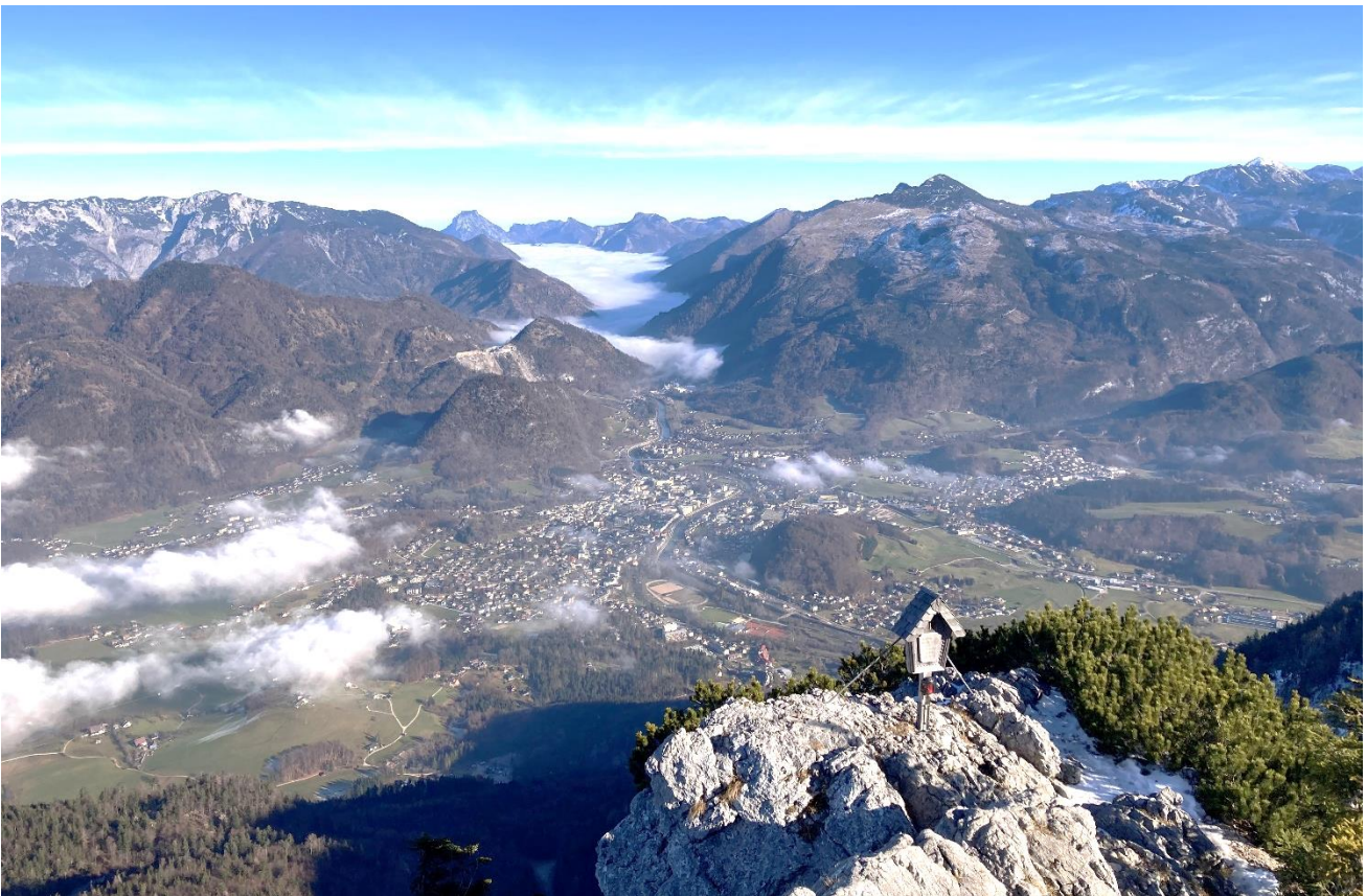
Katrin, 1542 m