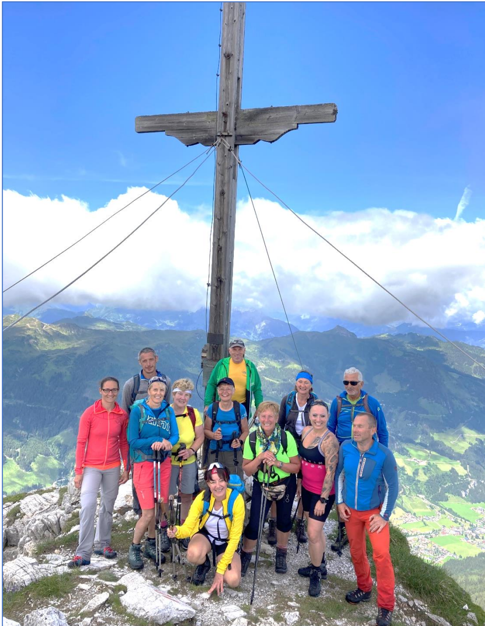
Ennskraxn, 2410 m